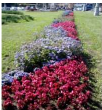
Ассортиментная ведомость (S цветника, 15м 2 )